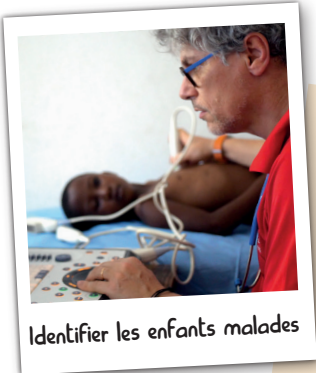
Identifier les enfants malades