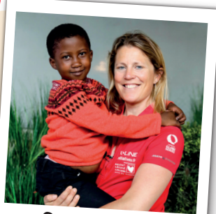
Organiser l'arrivée des enfants en France