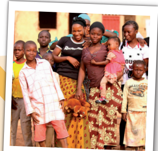
La convalescence et le retour guéri