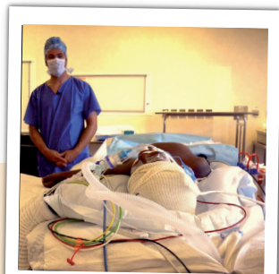
La phase chirurgicale