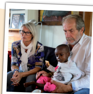
Séjour dans les familles d'accueil

Dès l'aéroport, les enfants rencontrent leur famille d'accueil. Habitant à proximité des centres hospitaliers partenaires, elles ont un rôle essentiel. Pendant environ 2 mois, ces familles bénévoles vont prendre soin d'eux au quotidien et les emmener aux différentes consultations médicales. Leur disponibilité, leur affection et leur présence tout au long du séjour, rassurent et apaisent ces enfants vulnérables.